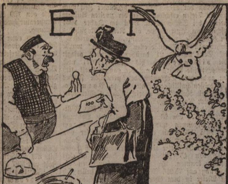
Im E-iten lauft man gern sich Eier, Ist noch im Frühling Friedensfeier?