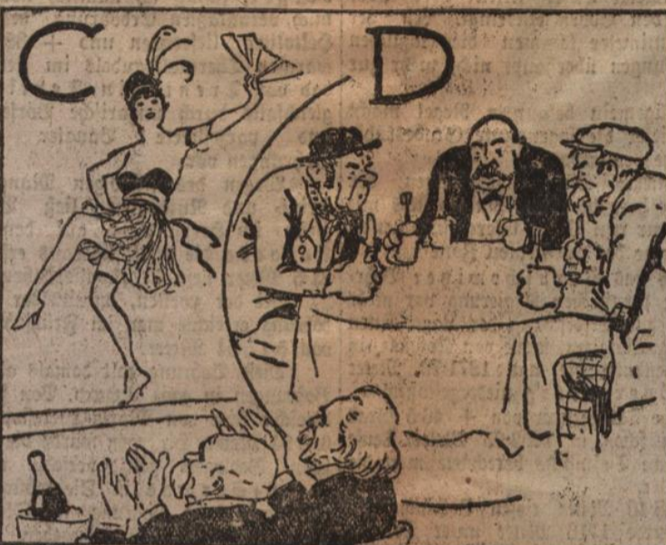
Man amüsiert sich bei Congressen, Dutschbierreich hat nichts zu pfeffen.