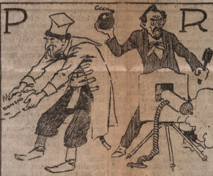
Der Pole liebt die P-istut, Der Rat regiert die Republik.