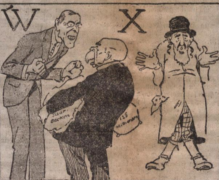
Herr Wilson ward oft willch wild, Der X-Fuß gibt sein schönes Bild.