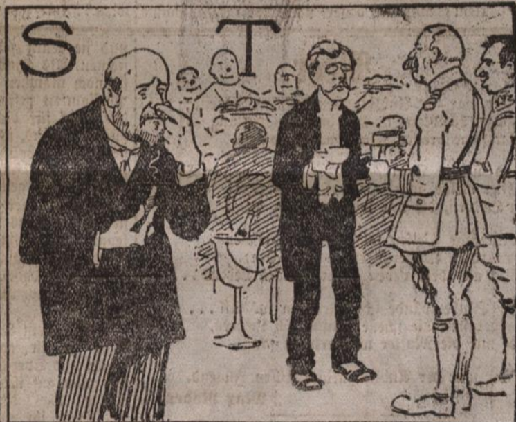
Auch Sez raucht keine gute Sorte, Der Tujar, der hat Tee und T-rie.