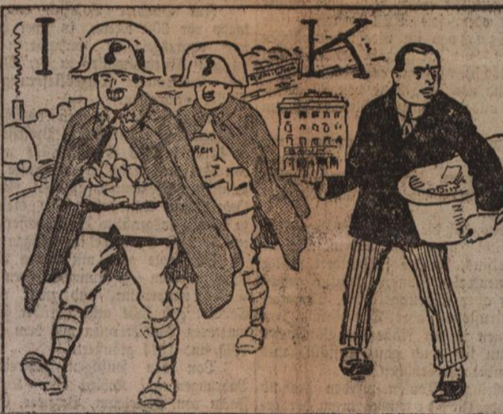
Der Italiener Reis gern ißt, Der Bela Kun ist Kommunist.