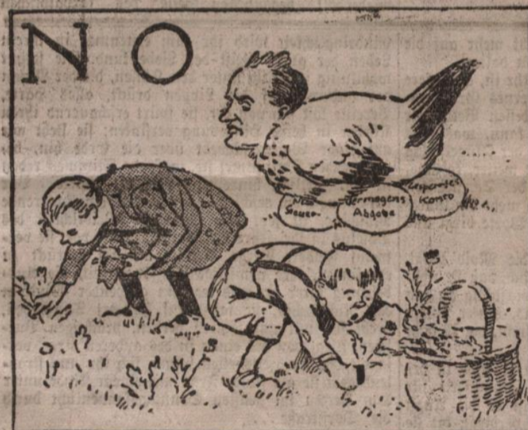
Natur, du wirst stets schöner, neuer, Hier sind Schumpeters Operierer.