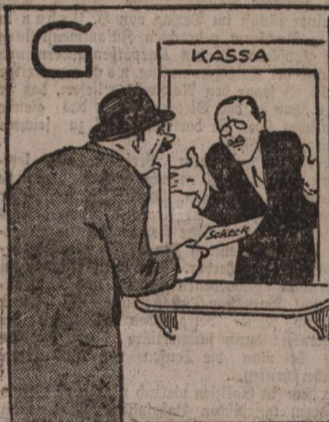
Wer G-ld hat, muß sich auch gedulden, Ein H-ii, der topet hundert Gulden.