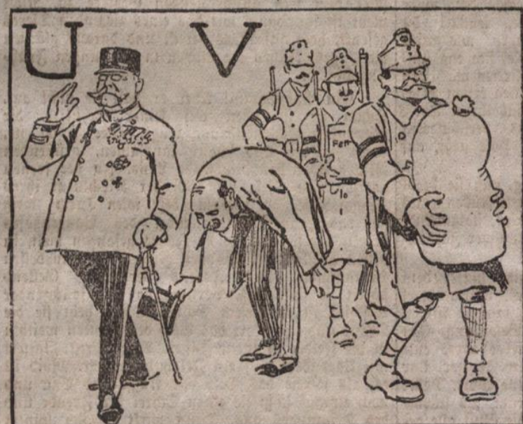
Der Untertan ist nun verwundeten, Die Voltswehr manches hat gekunden.