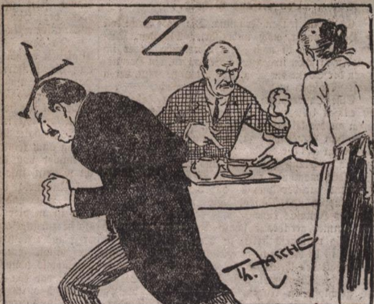
Den Dichter quält das fremde Y, Den Zuder triegt der Wiener nie.