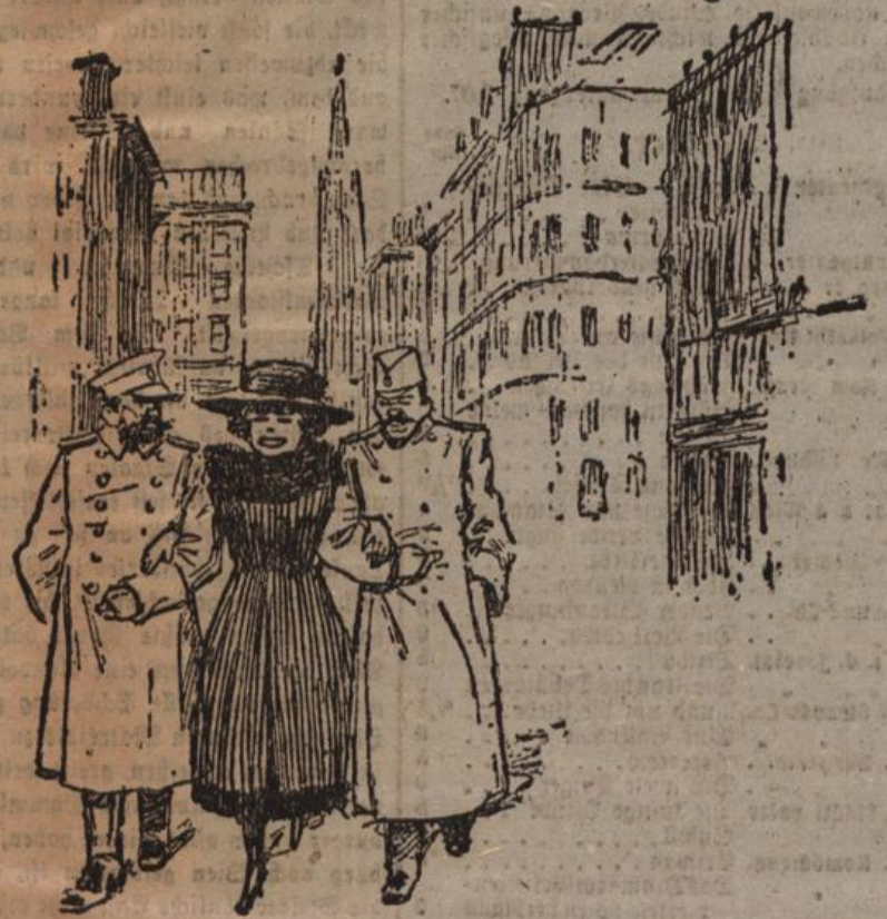
Die Südslawen nehmen nicht nur Kärnten, sondern auch die „Kärntner“-Strasse...