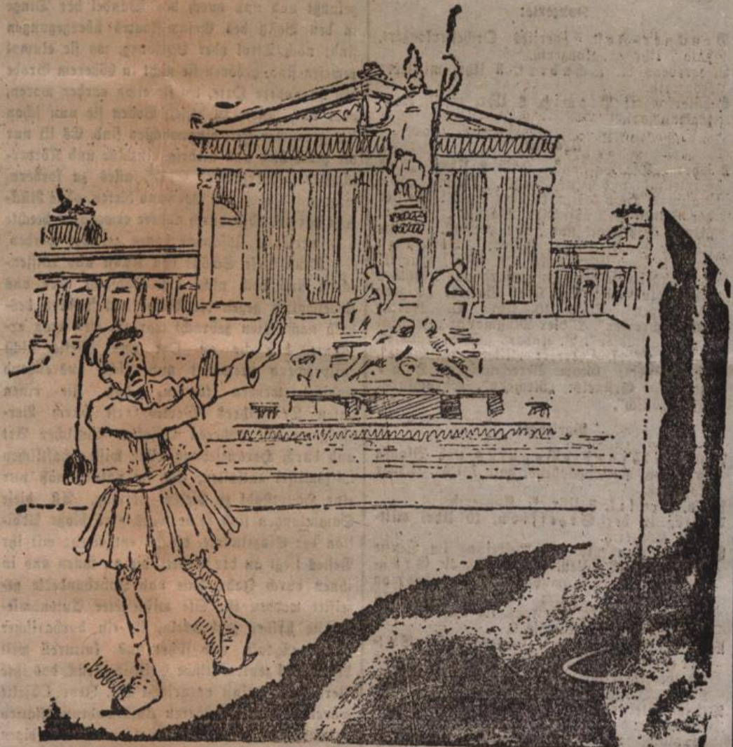
— nur die Griechen verschmähen leider die Pallas Athene.