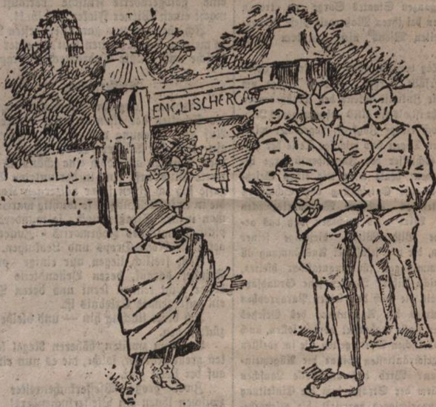
Den Kaisergarten fordern als „Englischen Garten“ die Engländer, als „Venedig in Wien“ die Italiener...