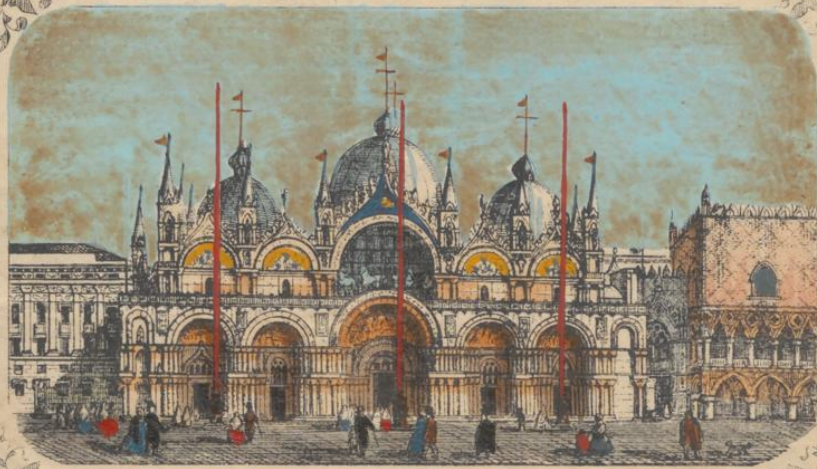
BASILICA DI S. MARCO