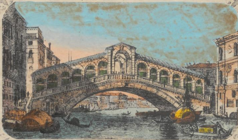
PONTE DI RIALTO.