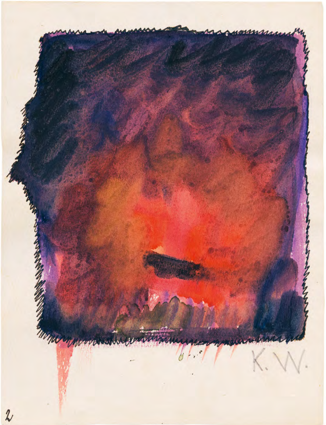
Abb. 2–3: Aus meinem Leben , Bl. 2 und 23. WM, Sign.: I. N. 250533/289 und I. N. 250533/310.