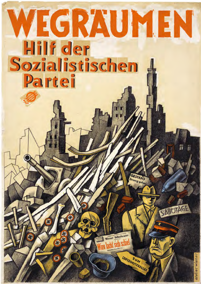
Abb. 11: Wegräumen. Hilf der Sozialistischen Partei. WM, Sign.: I. N. 238390/87.

mie für angewandte Kunst) nominiert, sondern erhielt auch eine Anstellung in der Propagandaabteilung der Partei und u. a. den Auftrag, das Kampfabzeichen der drei Pfeile als Symbol gegen Faschismus, Klerikalismus und Kapitalismus neu zu gestalten. In welchem Umfang Wieners künstlerische Arbeiten tatsächlich verwendet wurden, ist noch unerforscht. Ein Originalentwurf mit dem Slogan »Wegräumen. Hilf der Sozialistischen Partei« (Abb. 11) lässt vermuten,