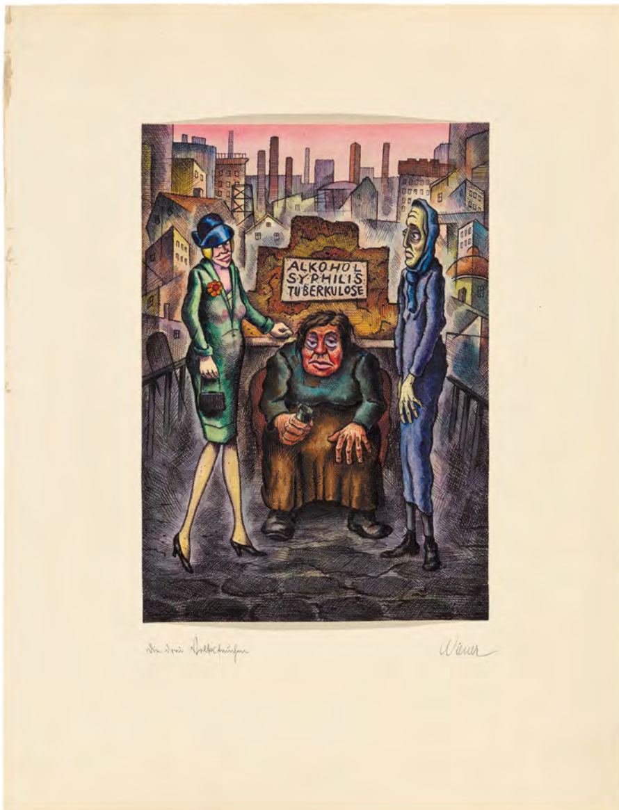
Abb. 4: Die drei Volksseuchen. WM, Sign.: I. N. 250533/959.

schiedliche weibliche Gestalten als Personifikationen des Alkohols, der Syphilis und der Tuberkulose vor einer düsteren Stadtkulisse zu sehen sind (Abb. 4). Die Darstellungen deuten bereits Wieners gespaltenes Verhältnis zu Frauen an, das in verschiedenen Arbeiten zwischen Misogynie und Heroisierung, Sehnsucht und Abwehr pendelt.