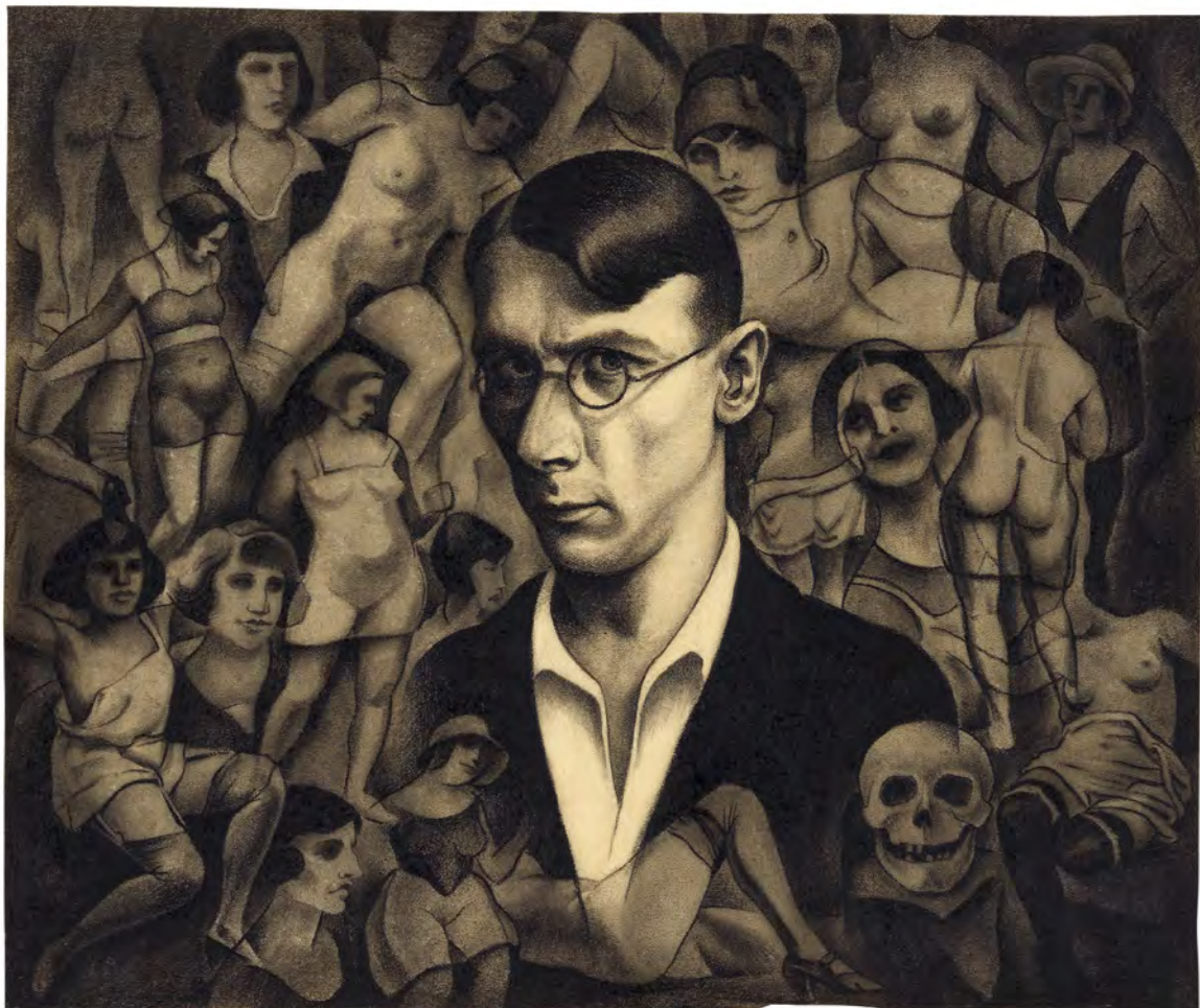
Abb. 8: Bedrängnis. WM, Sign.: I.N. 238390/81.

»Bedrängnis«, in welchem Wiener von etlichen Frauenakten und -köpfen, einschließlich einem Totenschädel, umgeben ist. Die von allen Seiten dicht an ihn heranrückenden, nur spärlich bekleideten Frauenkörper suggerieren nicht nur eine besonders intensive Beschäftigung mit der Thematik der Weiblichkeit, sondern auch ein Gefühl des Ausgeliefertseins (Abb. 8).