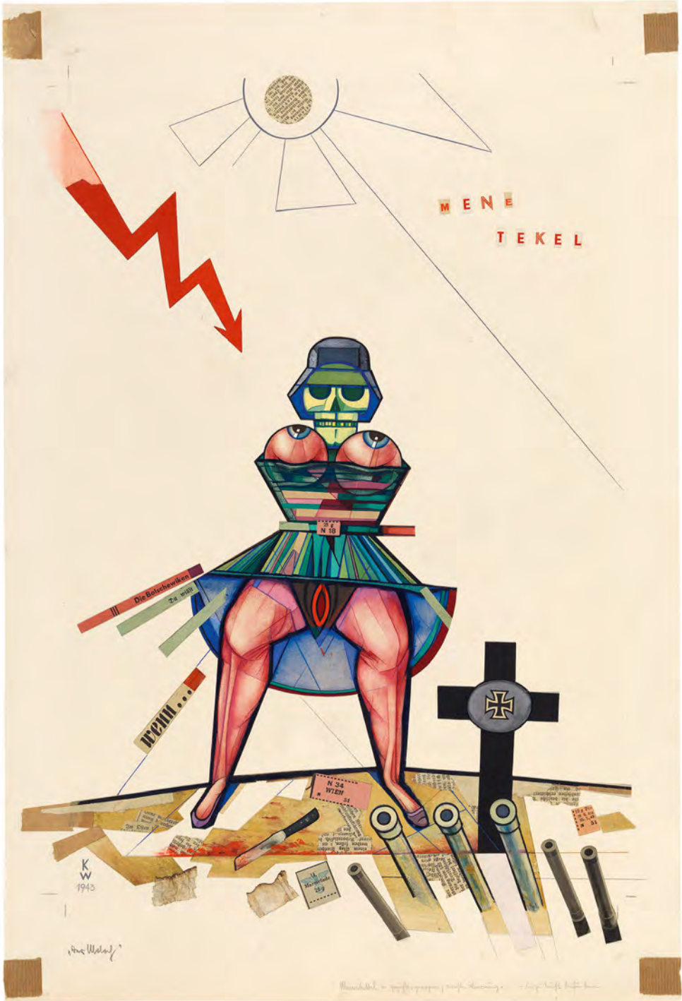
Abb. 10: Der Moloch. WM, Sign.: I.N. 72662.