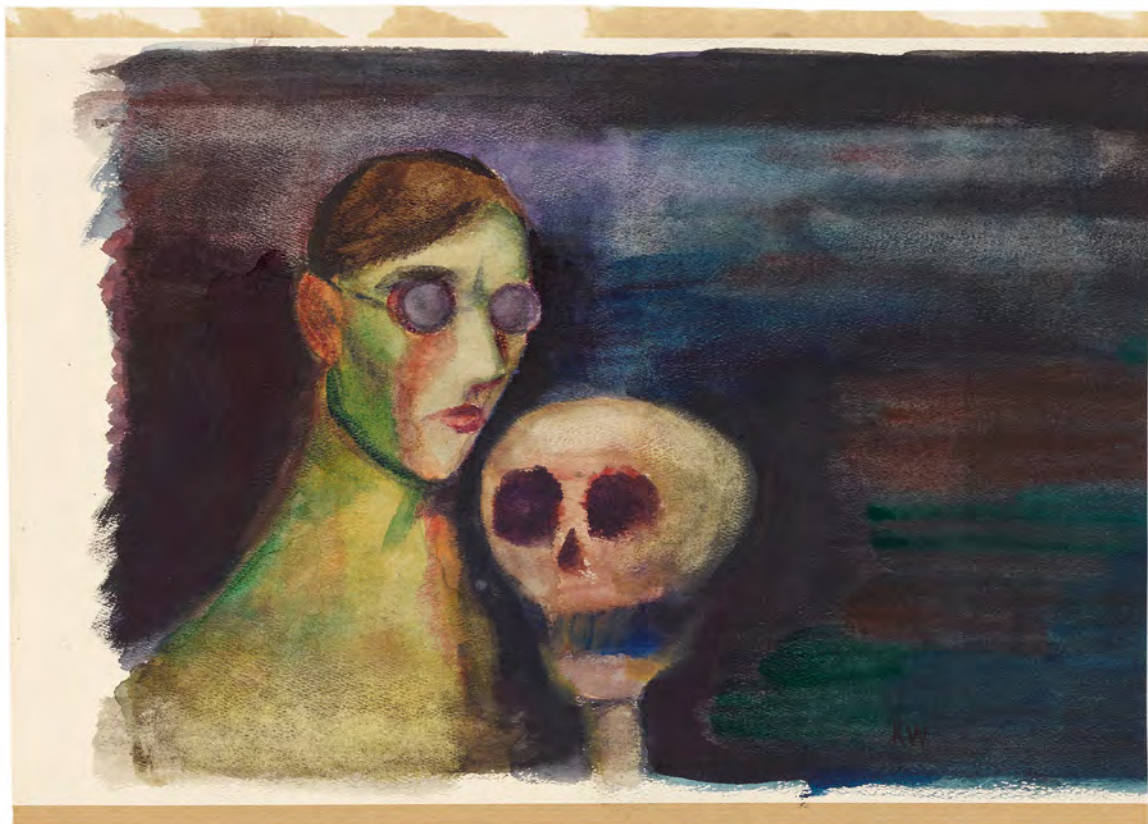
Abb. 7: Selbstporträt mit dem Tod. WM, Sign.: I.N. 250533/989.

Abseits der politisch-kriegerischen Katastrophe legen die Selbstporträts nicht allein dieser Schaffenszeit Zeugnis davon ab, in welchem permanenten psychischen Ausnahmezustand der Künstler lebte. Immer wieder taucht das Motiv der Todessehnsucht bzw. des Selbstmordes auf, wie schon in dem Anfang der 1930er-Jahre entstandenen Aquarell »Selbstporträt mit dem Tod« (Abb. 7).