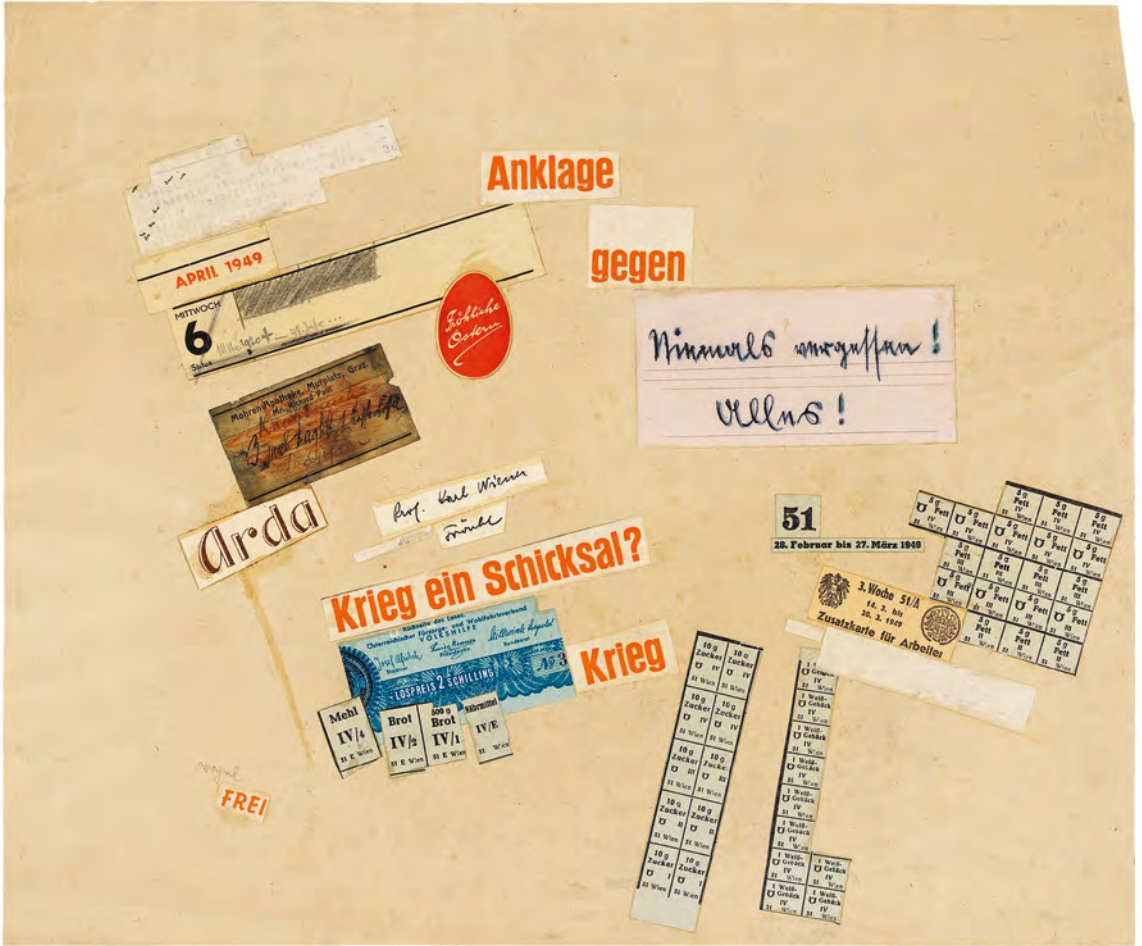
Abb. 12: Ohne Titel. WM, Sign.: I. N. 238390/51.

dass seine Herangehensweise und seine Ideen im parteipolitischen Sinne zu wenig plakativ waren, denn er führte in ihnen lediglich seine sehr persönlichen zeit- und gesellschaftskritischen Arbeiten, gespickt mit Totenköpfen, Ruinen, Bomben und Stahlhelmen, im größeren Format fort.