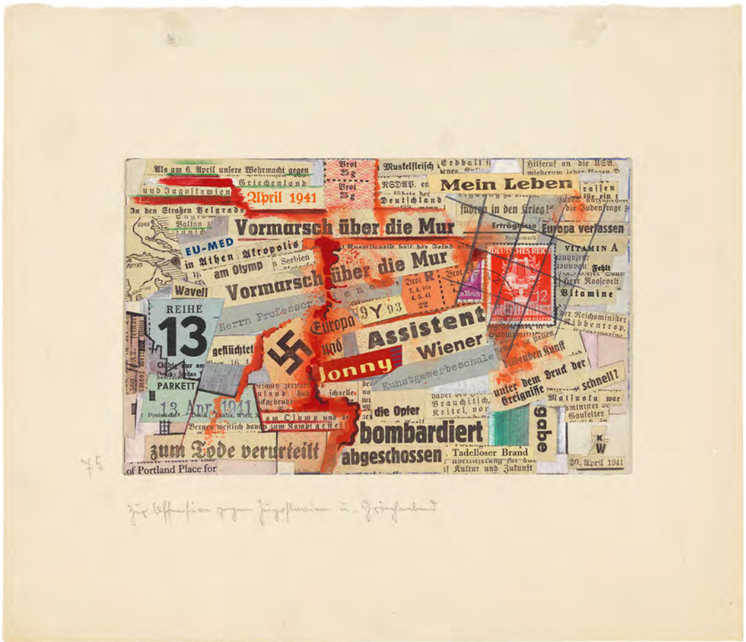
Abb. 6: Zur Offensive gegen Jugoslawien u. Griechenland.