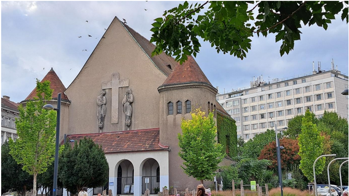
Abbildung 75: Ein vielfältiges Programm soll der Vereinsamung entgegenwirken und den sozialen Zusammenhalt stärken.

Ein vielfältiges Mitmach-Programm wirkte gegen die Vereinsamung und stärkte den sozialen Zusammenhalt im Grätzl. Neben einer Gesprächsrunde für Senior*innen, zwei Stadtspaziergängen zum Thema „Geschichten und Sagen aus Wien“ und zwei Theater-Workshops wurde ein offener After-Work-Gesangsworkshop für interessierte Personen angeboten.