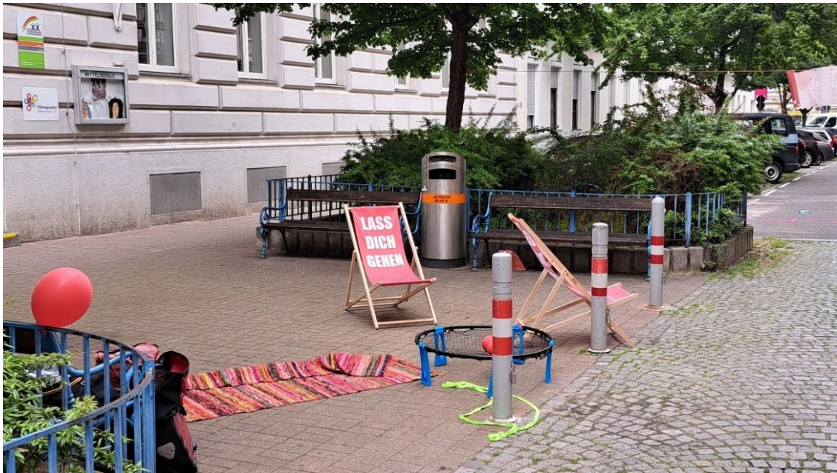
Abbildung 71: Die Frei-Tage laden zum freien Zusammenkommen im öffentlichen Raum ein.