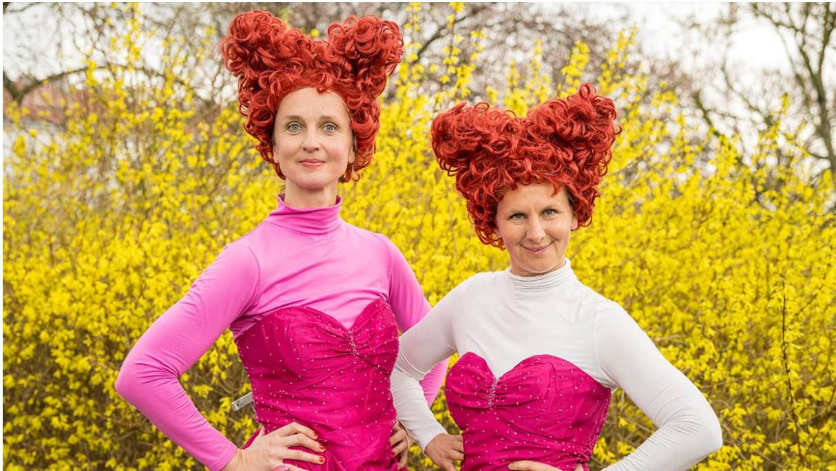
Abbildung 77: Beserlparktheater Traumland für Groß und Klein.

Theater für Jung und Alt, im öffentlichen Raum und bei freiem Eintritt. Der „Frischluff – Verein zur Förderung von Theater als Basiskultur“ brachte im Jahr 2025 mit „Traumland“ und „Die Herzköniginnen“ zwei sehenswerte Theaterstücke ins Grätzl 20+2.