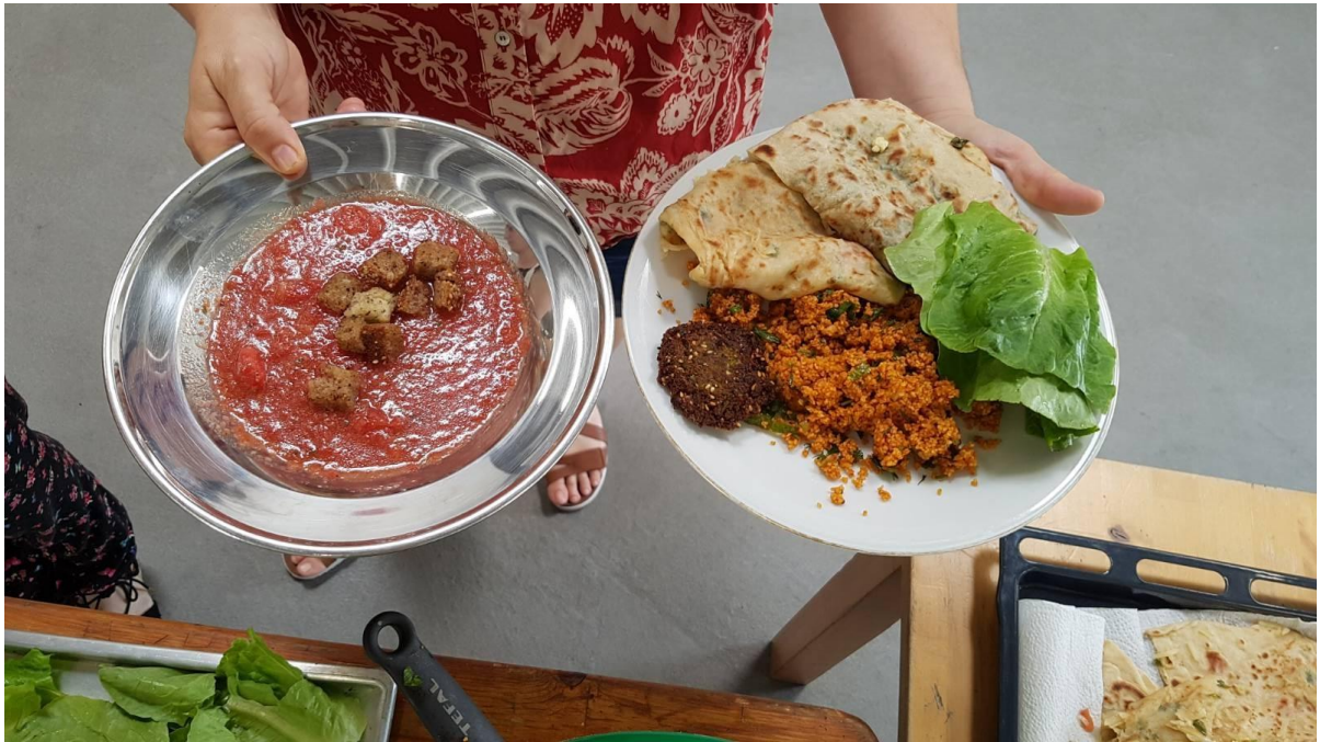
Abbildung 73: Mit Kochen Gemeinschaft erleben, dies war das Anliegen der VolkertKüche – Küche für Alle.

Nicht nur beim Reden, sondern auch beim Kochen kommen die Menschen zusammen!