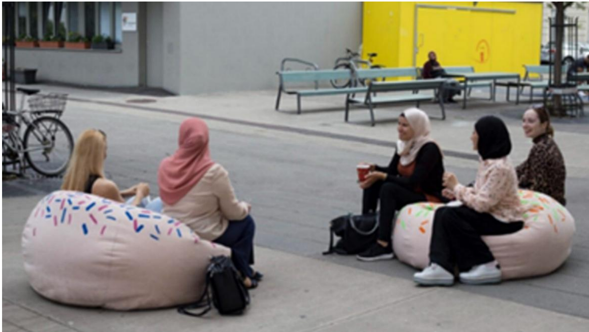
Abbildung 74: Frauen*Buchclub bringt Frauen miteinander ins Gespräch.

Der Frauen*Buchclub des Vereins Pyramidops lud Deutschlernende auf B1-Niveau zum Wissensgewinn und Gedankenaustausch ein. An insgesamt neun Samstagen wurden gemeinsam einfache Texte von Autorinnen mit Wien-Bezug gelesen, diskutiert und in einfache Sprache übersetzt. Dieses Projekt verband Sprachpraxis mit feministischer und literarischer Bildung und förderte den Austausch sowie die Teilhabe im öffentlichen Raum.