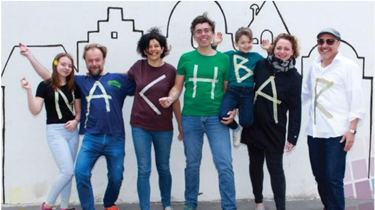
Abbildung 78: Das Grätzlfest Karl-Petrasch verbindet Menschen aus der Karl-Meißl-Straße und aus der Petraschgasse

Das Straßenfest „Karl-Petrasch“ in der Karl-Meißl-Straße und Petraschgasse bot den Bewohner*innen des Grätzls am 16. Mai 2025 eine gute Gelegenheit zum Kennenlernen, Vernetzen und Austauschen. Bei einem gemütlichen Beisammensein mit Speisen und Getränken sowie einem vielfältigen und bunten Unterhaltungsprogramm wurde der Zusammenhalt und das Gemeinschaftsgefühl gestärkt und der Grundstein für weitere Initiativen im Grätzl gelegt.