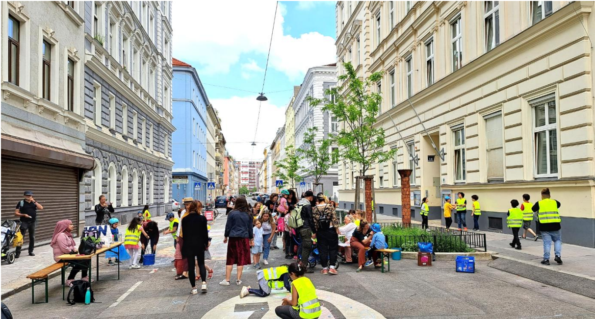
Abbildung 70: Ein Frei-Tag in der Darwingasse zeigt, auf welche Art und Weise der öffentliche Raum vor der Schule auch genutzt werden kann. Hier kommen die Menschen zusammen.

Im Rahmen von drei Straßenfesten wurde die Straße als Verweil- und Bewegungsraum genutzt. Ausgewählt wurden die Darwingasse, der Volkertplatz und die Alliiertenstraße. Es gab Spielmöglichkeiten wie Schach und Federball für Personen jeden Alters. Das Projekt bot die Möglichkeit, sich mit den Themen Mobilität, öffentlicher Raum, Klima und sichere Verkehrs- und Bewegungsräume für Kinder zu beschäftigen. Der Zusammenhalt in der Nachbarschaft wurde gestärkt, gleichzeitig wurden alternative Begegnungsräume geschaffen.