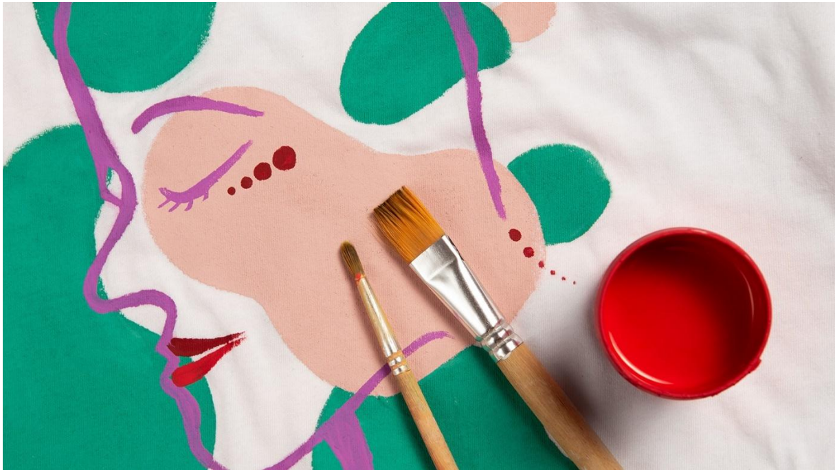
Abbildung 82: Beautii Klinik Dr. Barbara Ungepflegt, ein temporäres Kunstprojekt

Die „Beautii Klinik Dr. Barbara Ungepflegt“ war als temporäres Kunstprojekt im Gemeindebau Johann-Kaps-Hof konzipiert. Es verband kostenlose „Schönheitsbehandlungen“ mit künstlerischer Performance und reflektierte auf kritische und humorvolle Weise über Schönheitsideale, Körperkult und Konsumgesellschaft.