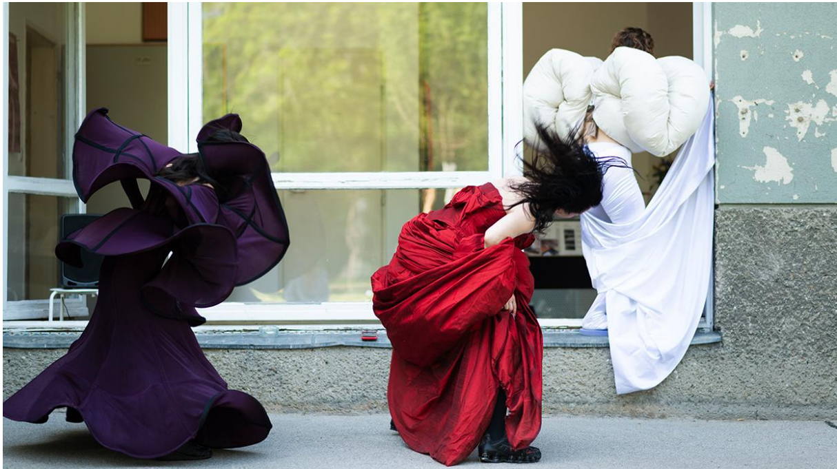
Abbildung 84: Tanz-Performance rund um den toten Pfirsichbaum. 1zwei3-Verein

„1zwei3 – Verein zur Förderung von Kunst“ hat seinen Standort im Gemeindebau Johann-Kaps-Hof. Im Zeitraum vom 30. Mai bis zum 20. Juni 2025 konnten dort Ausstellungen, Performances, Filmvorführungen, Konzerte und eine Dauerausstellung kostenlos besucht werden. In einer fünfteiligen Veranstaltungsreihe wurde die besondere emotionale Verbindung zwischen Menschen und Bäumen und die Beziehung der Bewohner*innen zu den wertvollen grünen Schattenspender*innen näher beleuchtet.