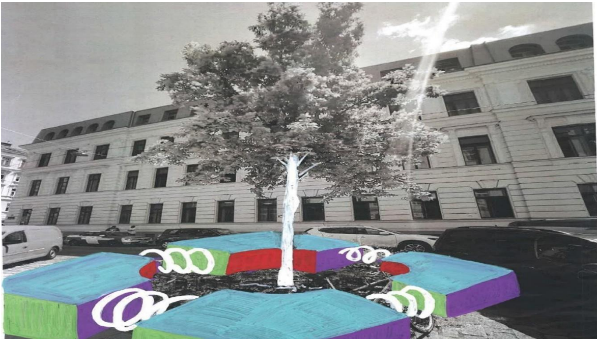
Abbildung 79: Kreative Stadtgestaltung im Workshop fördert die Mitgestaltung in der Stadt

Im Rahmen von insgesamt fünf Workshops zum Thema „Kreative Stadtgestaltung“ am Gymnasium am Augarten erhielten die Teilnehmer*innen Einblicke in die Mitgestaltung des Stadtbilds. Dies stärkte ihre kreativen Fähigkeiten und ermutigte die Schüler*innen, die Zukunft ihres Grätzls aktiv mitzugestalten. Die Jugendlichen erhielten dadurch die Möglichkeit, ihre Zukunftssorgen in Hoffnung und Handlungsbereitschaft umzuwandeln.