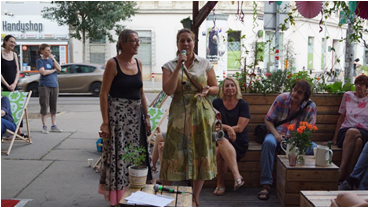
Abbildung 83: Radio Orange feiert im Grätzl seinen 27. Geburtstag.

Anlässlich des 27. Geburtstags des Freien Radios ORANGE 94.0 veranstaltete der Verein O-Sounds am 28. August 2025 einen medienpolitischen Talk und zwei Konzerte in der Grätzloase des Radiosenders am Gaußplatz. Das Ziel der Veranstaltung war, die lokale Gemeinschaft zu stärken, den Austausch über medienpolitische Themen zu fördern und mittels Musik kulturelle Diversität zu präsentieren.