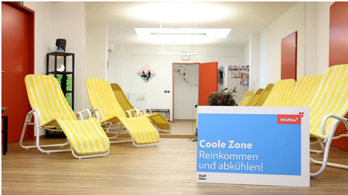
Abbildung 85: Cooler Zone

Cooler Zones sind öffentlich zugängliche, konsumfreie, kühle Innenräume, in denen die Temperatur nicht über 25 °C steigt. Die Etablierung derartiger Erholungsinseln in den heißen Sommermonaten ist eine Maßnahme aus dem Wiener Hitzeaktionsplan. WieNeu+ hat im Jahr 2023 die ersten beiden Cooler Zones der Stadt in einem Pilotprojekt umgesetzt.