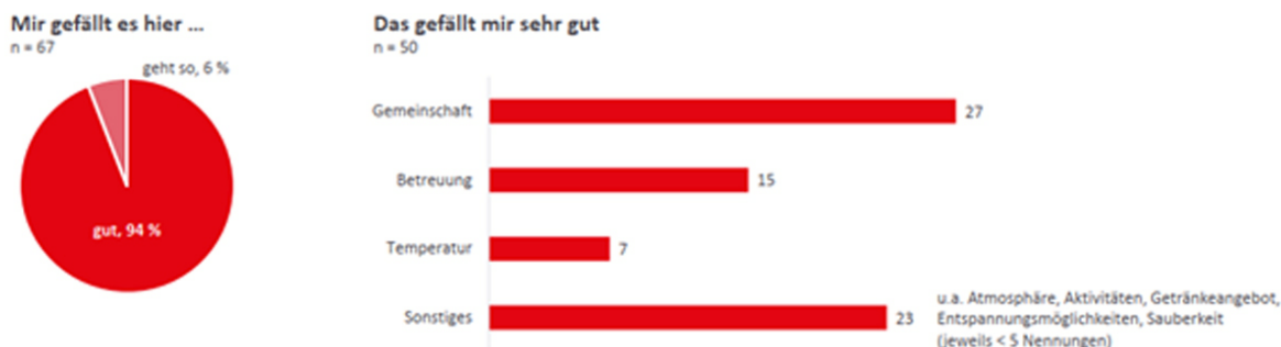
Abbildung 87: Ergebnisse der Feedbackbögen der Gäste.