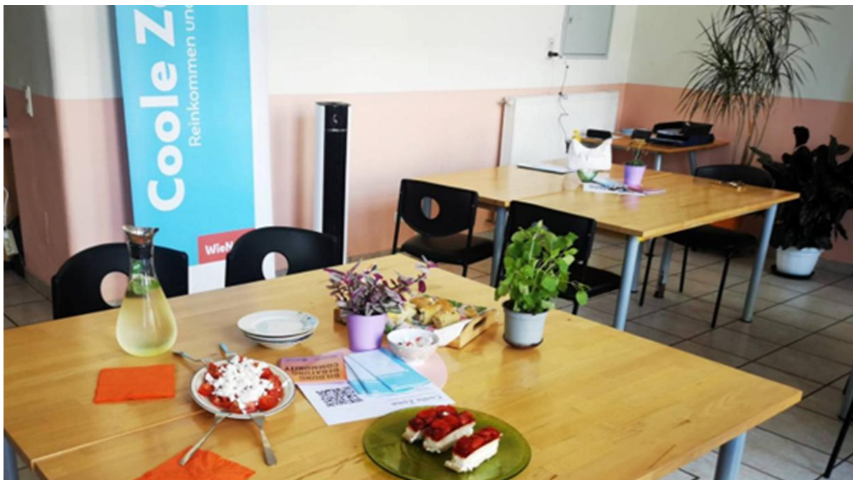
Abbildung 86: Frauentreff Coole Zone