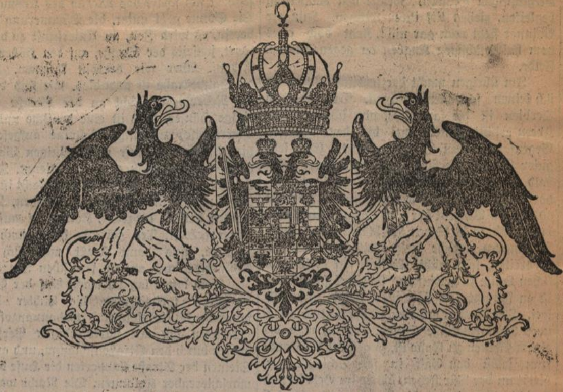
Das mittlere Wappen der österreichischen Länder.

Außer diesen kleinen und mittleren Wappen ist im Gesetze auch die Schaffung eines großen österreichischen und eines großen gemeinsamen Wappens vorgeesehen. Der Entwurf einer Zeichnung für beide ist aber, da diese Wappenkategorien gewöhnlich nicht zur Anwendung kommen, einem späteren Zeitpunkte vorbehalten.