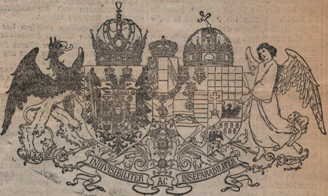
Das mittlere gemeinsame Wappen.

Wappen Oesterreichs und Ungarns in gleicher Größe erscheinen und in den einzelnen Wappenteilen die Kronländer in Oesterreich und die Königreiche sowie die königliche Freistadt Fiume ihren heraldischen Ausdruck