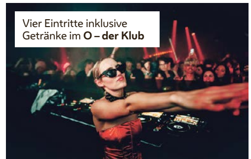
Vier Eintritte inklusive Getränke im O - der Klub