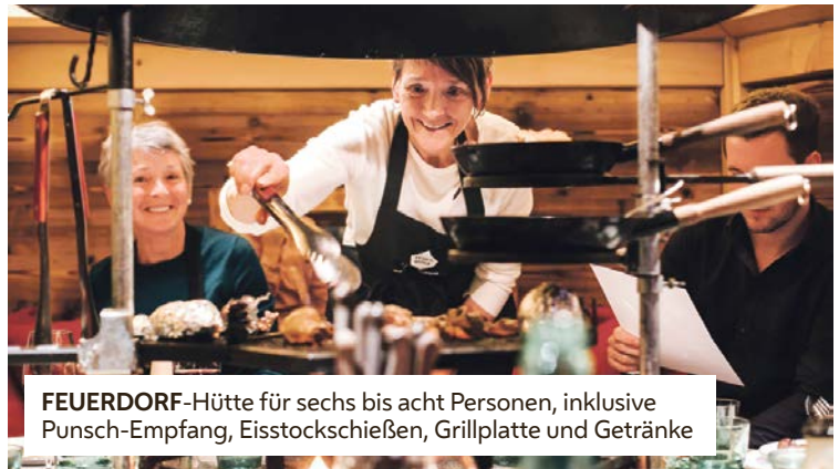
FEUERDORF -Hütte für sechs bis acht Personen, inklusive Punsch-Empfang, Eisstockschießen, Grillplatte und Getränke