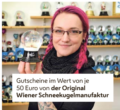
Gutscheine im Wert von je 50 Euro von der Original Wiener Schneekugelmanufaktur