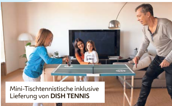
Mini-Tischtennistische inklusive Lieferung von DISH TENNIS