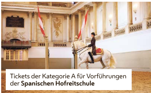
Tickets der Kategorie A für Vorführungen der Spanischen Hofreitschule