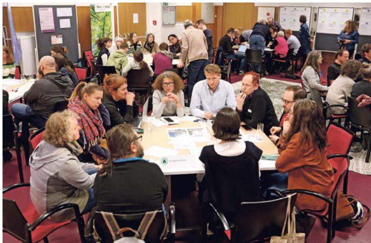
Gemeinsam mit der Bevölkerung werden die Vorschläge nun ausgearbeitet.

Ab sofort bieten 13 Standler*innen frische Lebensmittel, wie Fleisch, Gemüse, Brot sowie andere Spezialitäten im neuen Marktgebäude an. Besonderes Highlight ist die begehbare Aussichtsterrasse mit Blick auf die Wienzeile. marktamt.wien.gv.at