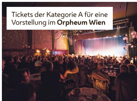
Tickets der Kategorie A für eine Vorstellung im Orpheum Wien