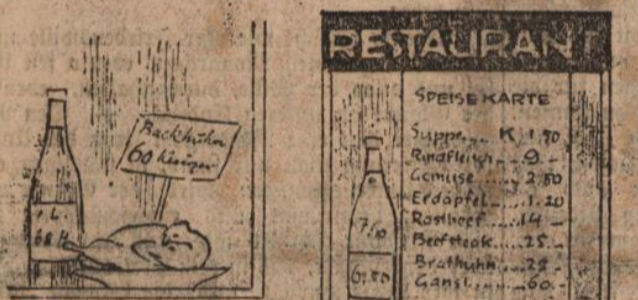
1914 GASTHAUS 1917