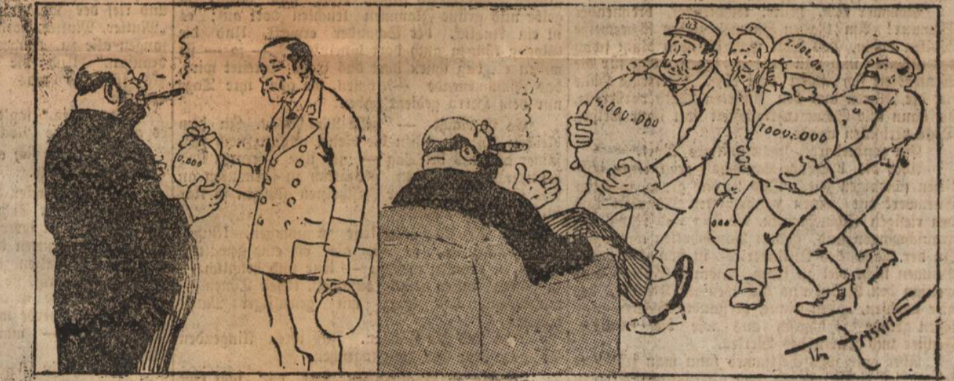
1914 SELCHWAREN 1917 1914 DIVIDENDEN 1917