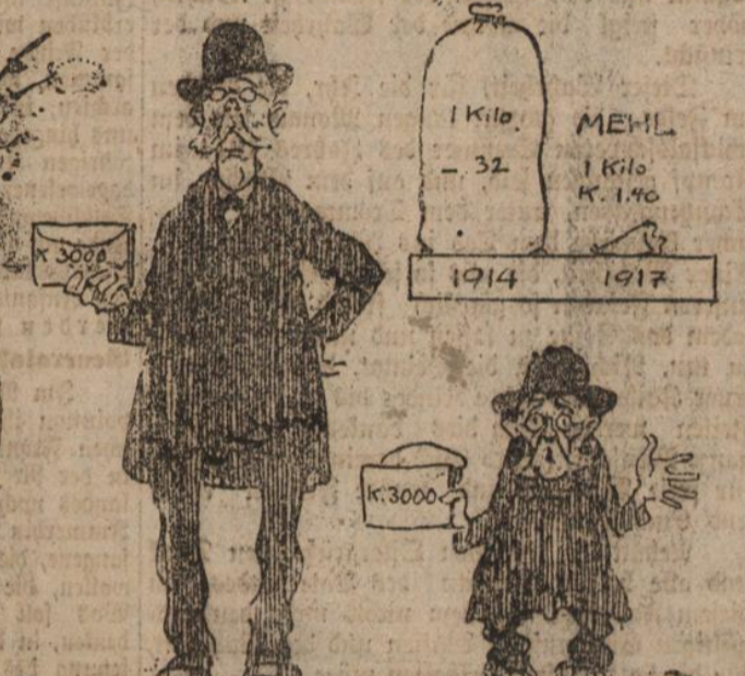
Ein Beamter, welcher ein Jahreseinkommen von K. 3000.- hat. Wie der gleiche Beamte mit demselben Einkommen 1917 ausschaun müsste!