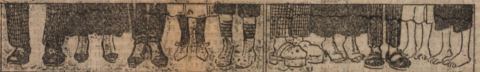
Was man 1917 für K. 300.- erhält!